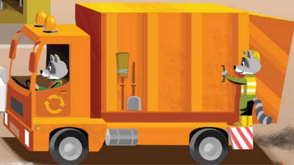
Камион Градске чистоће